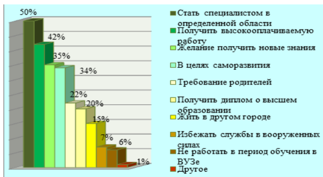
Диаграмма 1. Мотивы получения высшего образования [6]

Результаты следующего опроса представлены в диаграмме 2.[5]