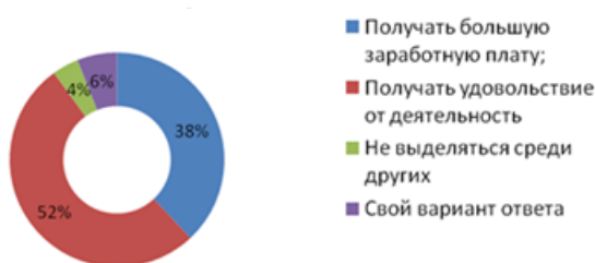
Диаграмма 2. Что для Вас главное в Вашей будущей работе?

Результаты следующего опроса представлены в диаграмме 2.[5]